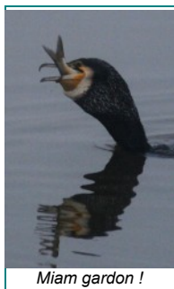
Miam gardon !